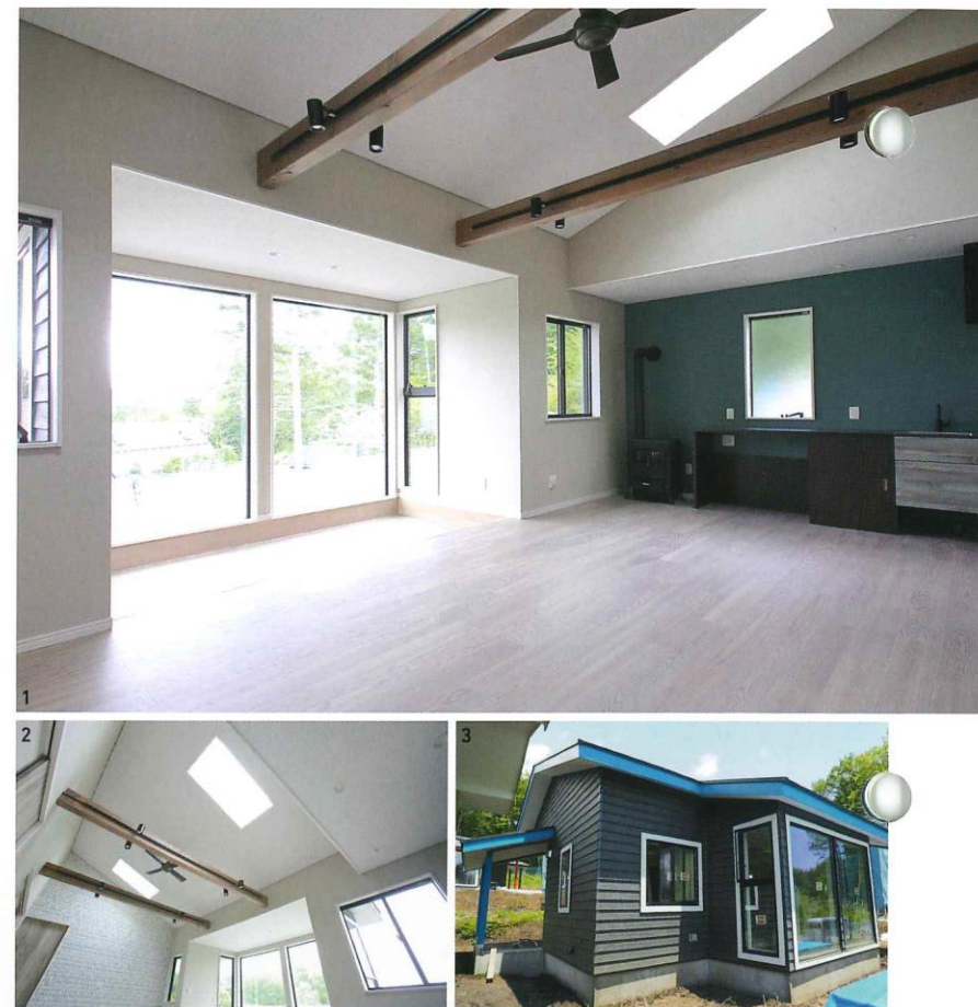
1. ゆったりと広く開放的なリビングダイニング。建物の内装はナチュラルとヴィンテージの2つのイメージに分かれ、雰囲気が異なる。2. 高い天井には天窓があり、夜は満天の星空を眺められることも。3. 全5棟のコテージはblue, yellow, red, greenの北欧アクセントカラーで分けられている。

広々としたリビングやベッドルームが極上の癒やしをもたらしてくれる。部屋から自然が楽しめるインナーテラスや、リラックスできるアウトサイドバスも特徴のひとつ。室内は洗練された北欧風家具で彩り、居心地のよさを追求。高原リゾートならではのホスピタリティを感じながら過ごせる別荘だ。