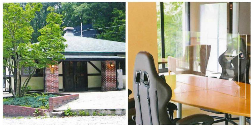
右/ミーティングに対応したテーブルにはパーテーションを設置。左/2021年7月10日にオープン。宿泊者利用料¥500、オーナー様、メンバー様¥500、一般¥2,000。

施設内にはフリーWiFiを完備。そのセキュリティはミリタリーグレードの信頼性があるの。情報保護や防犯の面でも心強い。自分のパソコンを利用するほか、パソコンやタブレット、プロジェクターの貸し出しもある。また室内の真ん中には大きなテーブルが設えられ、ミーティングにも大いに活用できるのが嬉しい。大きな窓の外に広がるのは、深閑とした別荘地の森。緑に癒やされながらする仕事は充実感もこの上ない。まさにワーケーションを行うのにぴったりの施設だ。