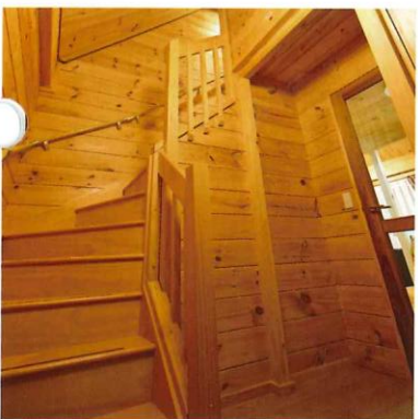
玄関から続く階段を上ると、2階には吹き抜けのベッドルームと個室のベッドルームがあり、息子が友人と訪れても十分な広さだ。