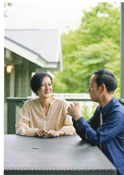
仕事の合間には、森の風に包まれたテラスでティータイム。気分転換にもなる。

りと集中して仕事を行うことができる。目の前に広がるのは、森の深い緑。それだけでストレスフリーになり、仕事もはかどるものだ。またオフィスとは違い、自分の時間軸で仕事ができるのも別荘の醍醐味。朝は早めに起きて森の散歩で目を覚ましたらさっそく仕事。夜は早めに切り上げて、星空