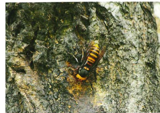
もしハチに刺されてしまった場合はすぐにお近くの医療機関へ。

夏から秋にかけては、ハチが活発に行動する時期となります。ハチの巣を見つけた際には管理センターへご一報ください。また、ハチを刺激すると攻撃してくることがありますので十分ご注意ください。