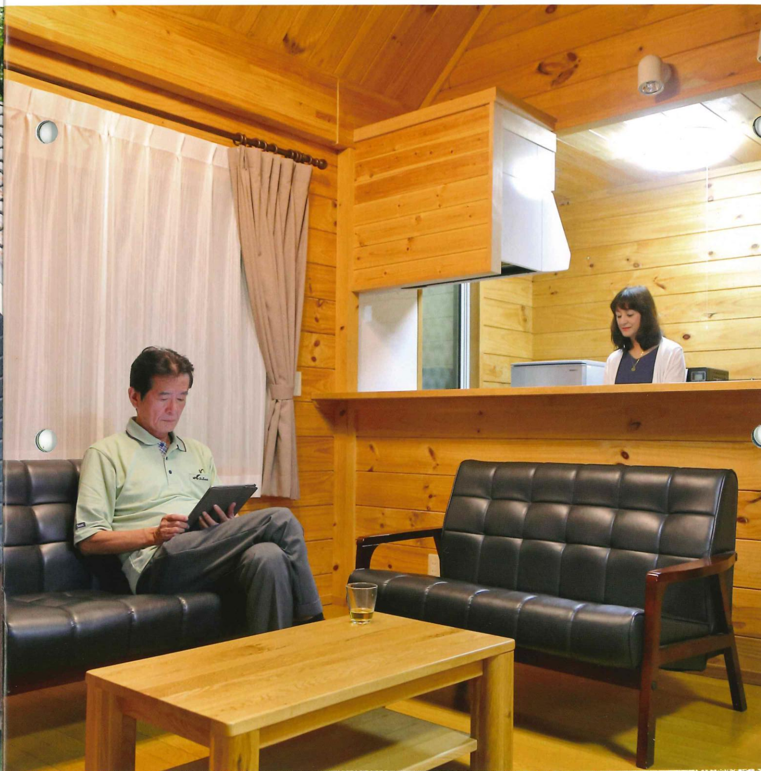
いつ来てもホテルのように部屋の隅々まで清掃が行き届いた環境で過ごすことができるのは、『ReVOS』のサービスを利用しているオーナーの特権だ。