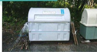
正しいゴミ出しの例

高原の爽やかなシーズンの到来とともに、ルールを守らないゴミ袋が散見されます。臭いや見た目などから分譲地の人々にも迷惑がかかり、また美観も損なわれます。「ゴミ出しルール」を守って、皆様できれいな分譲地にいたしましょう