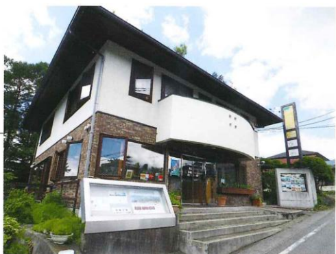
大泉駅前ショールーム