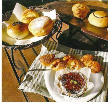
清らかな水と厳選素材で作られるパン。店巡りを楽しんで、好みのパンを見つけてみては。