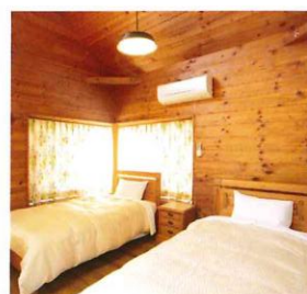
※写真はイメージとなります

別荘の購入をご検討されているお客様のために、体験宿泊をご用意しております。八ヶ岳の朝の清々しさと夜の静けさ、家の中にいながらにして聞こえてくる鳥のさえずり……。ぜひ、ご自身の五感で八ヶ岳の自然や分譲地の環境を感じ、「過ごす」イメージでご宿泊ください。お客様のライフスタイルのご希望に応じた、販売物件のご案内もいたします。