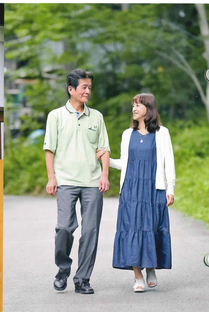
2人で別荘の周囲をのんびりと散歩。 「森林浴を楽しみながらの散歩はリフレッシュになります」と話す。