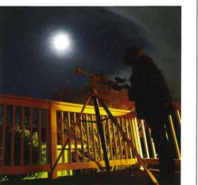
別荘のテラスで天体観測に興じるのもよい。何物にも代え難い幸福がここにある。