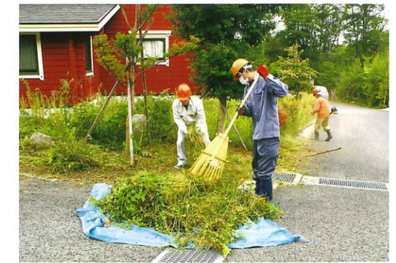
敷地内の整備にお困りの際は、管理センターにご連絡ください。

近隣に住まれる方同士が、お互いに気持ちよく別荘地での生活を楽しめるよう敷地内の整備にご協力をお願いいたします。また、草刈や枝落とし、伐採などのご相談は管理センターにて承ります。