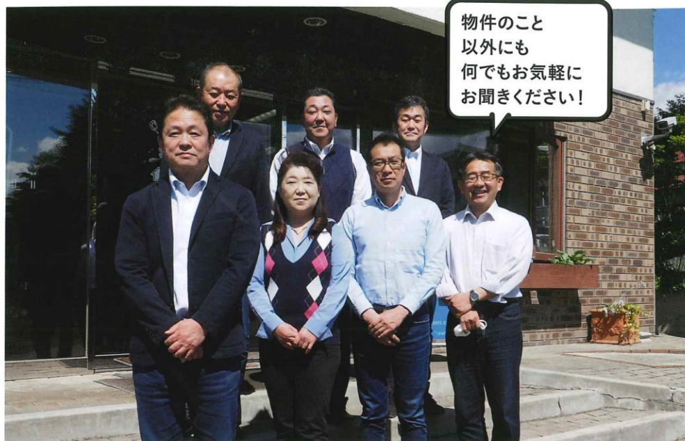
営業スタッフ一同

土地探しから新築、中古物件など、八ヶ岳への移住や別荘、週末住宅をお考えの方を手厚くサポートいたします。ほかにも、別荘の増築やリノベーション、売却といったお悩みや貸別荘としてのご活用など、様々な別荘所有のスタイルからお客様に最適のご提案をいたします。JR小海線甲斐大泉駅から徒歩1分の場所に位置する「大泉駅前ショールーム」へお気軽にお越しください。