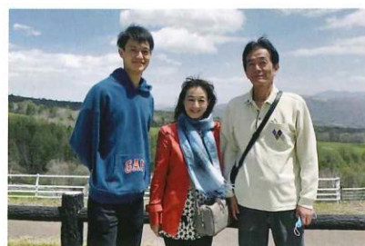
小淵沢や清里、大泉にある日帰り温泉施設へ出かけることが多いという2人。自然に囲まれて入る温泉はまた格別だ。