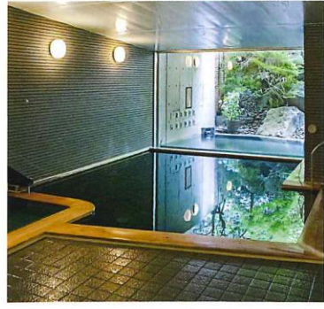
泉郷にある「花いずみの湯」(日帰り¥1,000)は、肌がツルツルになると評判の湯。

判。またパンの激戦区、八ヶ岳界限には素材にこだわる多彩な店が点在。好きなパンをいろいろ買って別荘で味わうのもまた楽しいものだ。 プライベートも仕事も楽しめる別荘でのデュアルライフ。まずは泉郷の賃貸借システム「ReVOS」を利用して気軽にスタートしてみたいかがだろう。今夏完成の「星降る森のレジデンス第Ⅱ期」ならその夢も叶えてくれる。