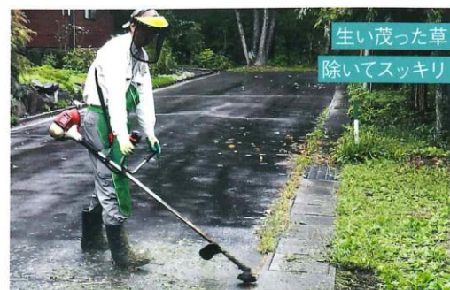
生い茂った草を 除いてスッキリ！

5月～8月上旬にかけて、全管理分譲地を対象に草刈作業を実施しました。鬱蒼とした草が道路にはみ出して歩道が狭くなったり、通行時の視界を遮るため、見通しの確保及び通行に支障が出ないようにすることが目的です。そのため、作業は草の生育旺盛な陽当たり良好な区画・別荘地・道路から優先的に、例年より早い時期から作業を行いました。