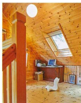
天窓からの光で明るいロフトスペースは、パソコンを使う際のワークスペースとして利用。