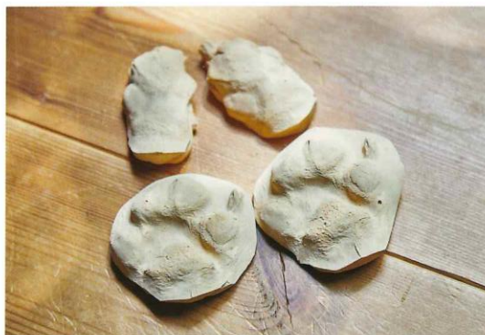
剛さんが手作りしたコタロウ君の足形が飾られることから、夫妻の深い愛情が感じられる。

石坂家に来てから4カ月。すっかり元気になっただるま君と一緒に散歩に出かけるのが、夫妻にとって何よりの幸せな時間となった。春にはフキノトウの芽をかじり、夏には森の道に咲く山野草の香りを嗅ぎ、秋は道端に溜まった落ち葉をサクサクと踏みしめて歩く……。凍とした冬の寒ささえも気にならない。幾筋もある散歩コースは、気分によって選び放題だ。たとえ同じ道を歩いたとしても、季節ごとに森も空気も表情が変わるため飽きることはない。 石坂さん夫妻とだるま君の八ヶ岳で暮らす日々は、常に新鮮な驚きと発見に満ちているようだ。