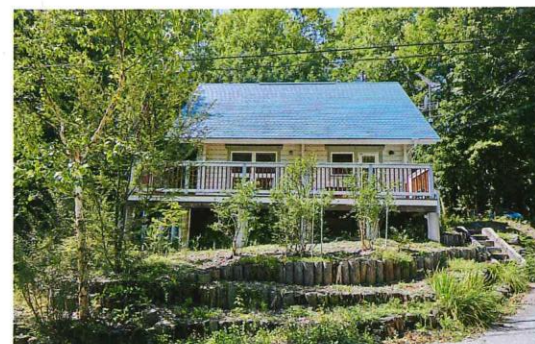
家の中はシンプルに、とにかく広いデッキとドッグランにこだわった夫妻の理想の家。