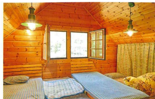
三角屋根と小窓が可愛い2階の寝室。毎晩、だるま君を真ん中の川の字で眠りにつく。