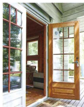
愛犬がデッキやドッグランと気軽に行き来できるように、出入口を数箇所に設けた。