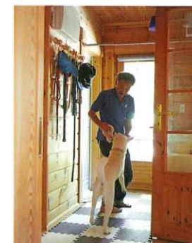
外遊びを楽しんだ後、汚れた足などをすぐに洗い流せるよう、玄関の脇に水廻りを集結させた。