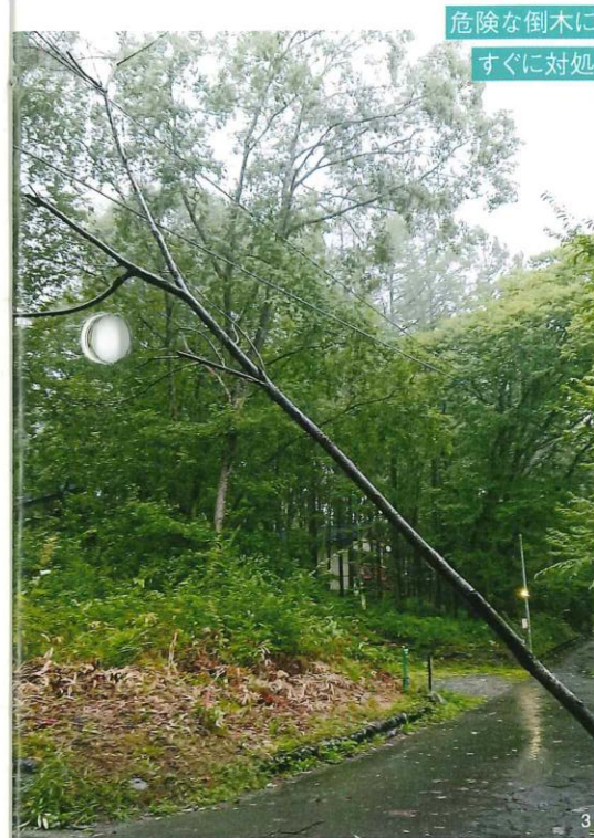
危険な倒木には すぐに対処！

8/8、8/23、9/4、9/30に発生した台風や豪雨により、土砂流出や倒木、停電、側溝排水が溢れるという被害がありました。事前に雨雲発生状況を確認したうえで、土のうづくりや側溝確認巡回を行い、その影響を最小限に止めることに努めました。また、想定外の雨の勢いによる冠水被害発生に対しては、通行止め表示や土のうを追加排水経路の調整を即日実施することで応急処置を行いました。事後には、異常発見対象地のオーナー様への個別連絡をはじめ、緊急時一斉メール受信登録者へメール配信での報告、井戸施設の異常有無の確認など、迅速な対応に努めました。