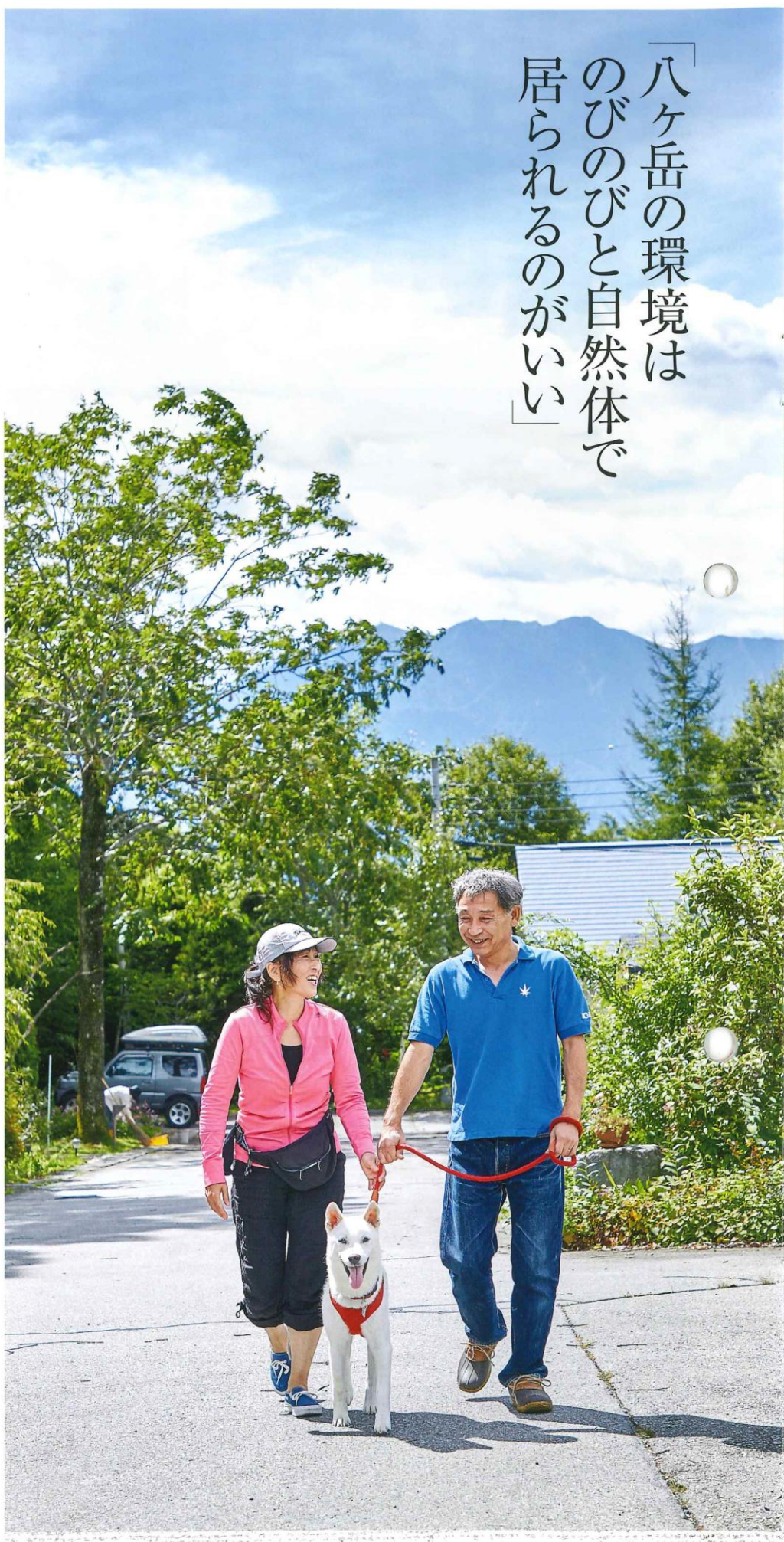
だるま君との散歩が夫妻の日課。日によってルートを変え、様々な空気や景色を楽しんでいる。