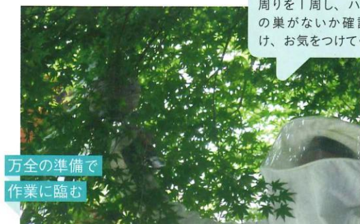
万全の準備で 作業に臨む

秋口はハチが獍猛になる時期です。家に入る前に家の周りを1周し、ハチやハチの巣がないか確認を心掛け、お気をつけてください。